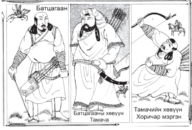
“Монголын нууц товчоо монгол зургийн аргаар” номын хэсэг